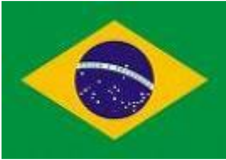
Brasilien, Sao Paulo